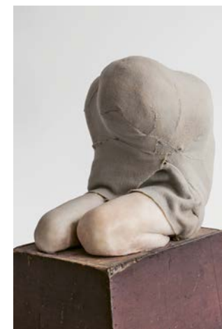
Zonder Titel, 1993, Courtesy of the artist

When Berlinde De Bruyckere came to Hamburg in autumn 2021 to install her sculpture Arcangelo II , 2020, which had been acquired by the Hamburger Kunsthalle, she was deeply impressed by Ernst Barlach's wooden sculptures when she visited our museum. These awakened a long-held desire to work in wood in a new way, and the result is a group of polychrome wooden sculptures that will be premiered in our exhibition. In addition Berlinde De Bruyckere is showing a selection of her sculptures and drawings in dialogue with pieces by Ernst Barlach from our collection.