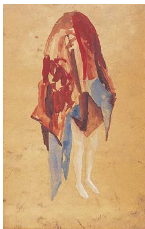
1 Zonder Titel, 1994, Collection M HKA / The Flemish Community, Antwerpen / Antwerp 2 Zonder Titel, 1995, Privatsammlung, Belgien / private collection, Belgium 3 Wezen, 2003–2004, Privatsammlung / private collection, Merelbeke; Fotos / photos: Jan Pauwels (1), Mirjam Devriendt (2, 3)