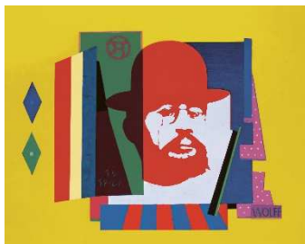
07 Willy Wolff: Henri Toulouse-Lautrec , 1969 Öl auf Hartfaserplatte, 75 x 95 cm Albertinum Galerie Neue Meister, Staatliche Kunstsammlungen Dresden © VG Bild-Kunst, Bonn 2020; Foto: Elke Estel/Hans-Peter Klut