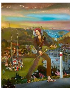
09 Dieter Weidenbach: Unterwegs , 1976 Öl auf Hartfaserplatte, 119,5 x 99 cm Albertinum Galerie Neue Meister, Staatliche Kunstsammlungen Dresden © VG Bild-Kunst, Bonn 2020