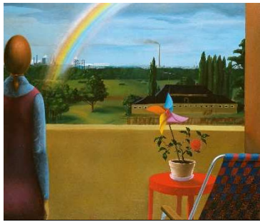
05 Uwe Pfeifer: Dialog I , 1975 Öl auf Hartfaserplatte, 91 x 105 cm Albertinum Galerie Neue Meister, Staatliche Kunstsammlungen Dresden © VG Bild-Kunst, Bonn 2020