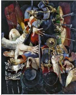
06 Bernhard Heisig: Preußischer Soldatentanz , 1978/79 (2. Fassung) Öl auf Hartfaserplatte, 151 x 121 cm Albertinum Galerie Neue Meister, Staatliche Kunstsammlungen Dresden © VG Bild-Kunst, Bonn 2020