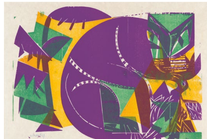
HAP Grieshaber: Katze und Vogel / Cat and Bird, 1960