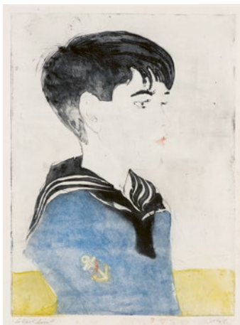
Rolf Nesch: Junge im Matrosenanzug / Boy in a Sailor's Suit, 1929