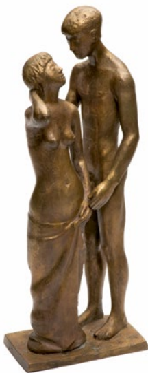
Gerhard Marcks: Junges Paar / Young Couple, 1967

Ernst Barlach Haus – Stiftung Hermann F. Reemtsma Jenischpark, Baron-Voght-Straße 50A, 22609 Hamburg T 040-82 60 85, info@barlach-haus.de www.barlach-haus.de